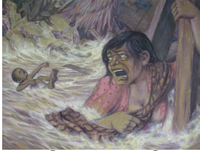
সুনামী : দয়াময় ঈশ্বরের তাণ্ডবলীলা

এই সকল বক্তব্যের বৈজ্ঞানিক বিশ্লেষণ করলে বহু প্রশ্নের জন্ম হতে পারে। তা হলো - কথিত সৃষ্টিকর্তা (সৃষ্টিকর্তা নন কেন?) মহোদয়টির উৎপত্তি বা সৃজন হলো কেমন করে? এই মহাজগৎ তৈরীর জন্য প্রয়োজনীয় উপকরণই বা (materials) পেলেন কোথায়? জন্মমৃত্যুর নিয়ন্ত্রন যদি তিনিই করেন তবে নিঃসন্দেহে বলা যায় যে তিনি মোটেই মহাজ্ঞানী,পরম করুণাময় ও সুবিবেচক নন। উদাহরণ হিসেবে আমাদের বেশি দূরে যাওয়ার দরকার নেই, ১৯৯১'র বাংলাদেশের উপকূলবর্তী অঞ্চলে ঘূনিঝড়ের তাণ্ডব, ৯/১১ এর বিশ্ববাণিজ্যকেন্দ্রে বিমান হামলা, সাম্প্রতিক (২০০৪) ঘটে যাওয়া ভয়াবহ সুনামির করালগ্রাস কেড়ে নিয়েছে অসংখ্য নিরাপরাধ মানুষের প্রাণ, নিরপরাধ নারী, অবুঝ শিশু, বিকলাঙ্গ নারী-পুরুষ, ও গর্ভবতী মা। ভেংগে- চুড়ে ধুম্বে মুচড়ে দিয়েছে মানুষের ঘর-বাড়ি, গাছ,পালা, ফসলের মাঠ, ভাসিয়ে নিয়ে গেছে বহুকষ্টে গড়ে তোলা রাস্তা-ঘাট, হাট বাজার, গরু ছাগল সহ মানুষের সকল সৃজনশীল কর্ম।